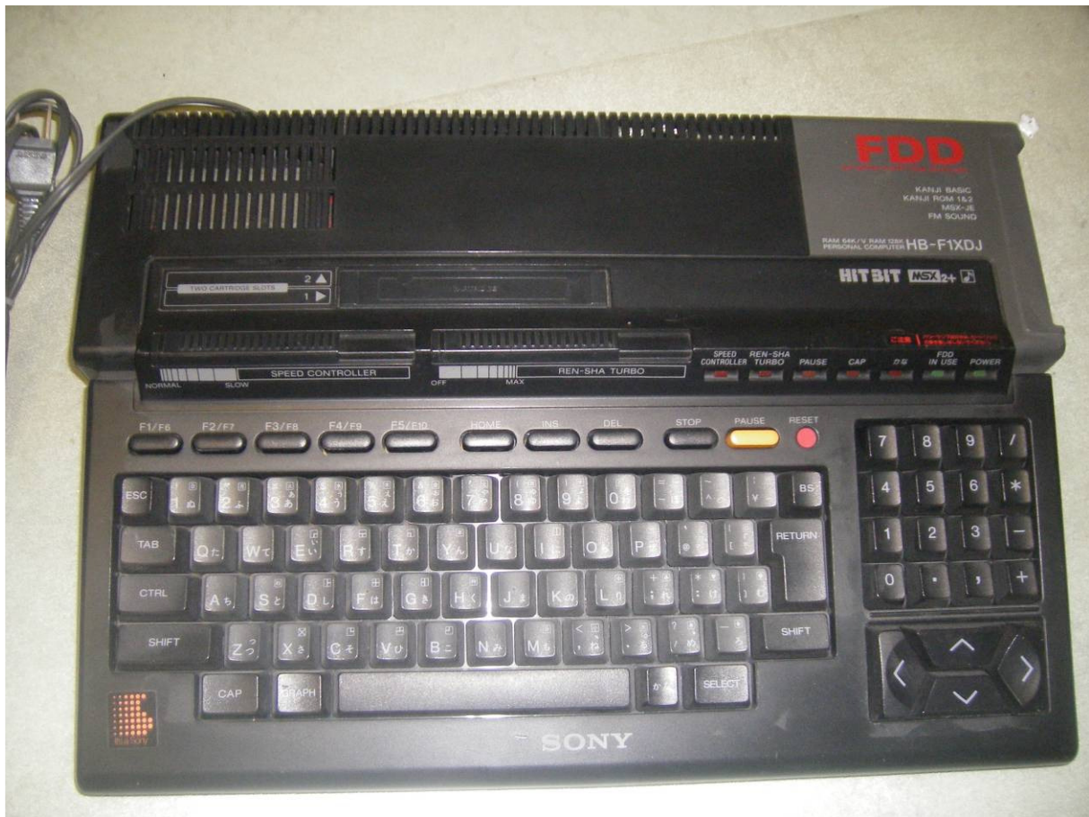
MSX-2+ computer, Sony HB-F1XDJ

Ook bij deze computers komt het voor dat de diskdrive niet meer wil werken. Het is eenvoudig om de drive te vervangen, omdat de connectoren precies passen op de vervangende diskdrive.