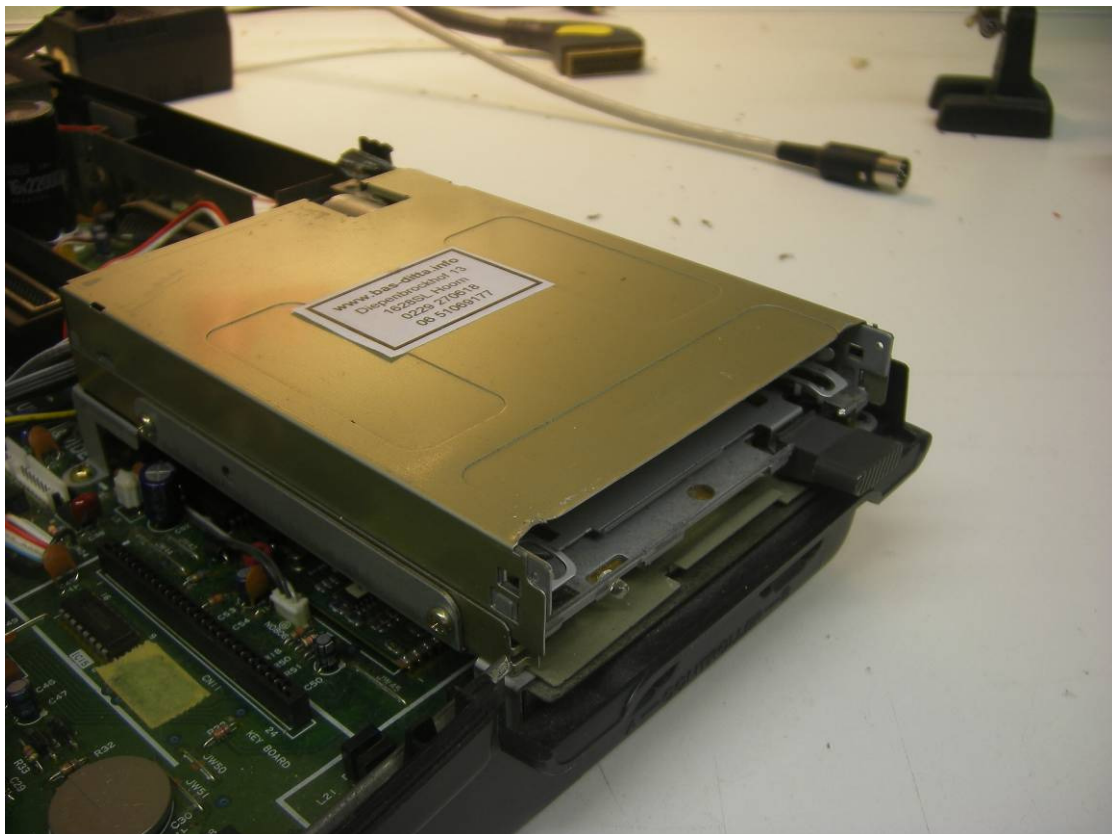
De nieuwe diskdrive in de Sony HB-F1XDJ