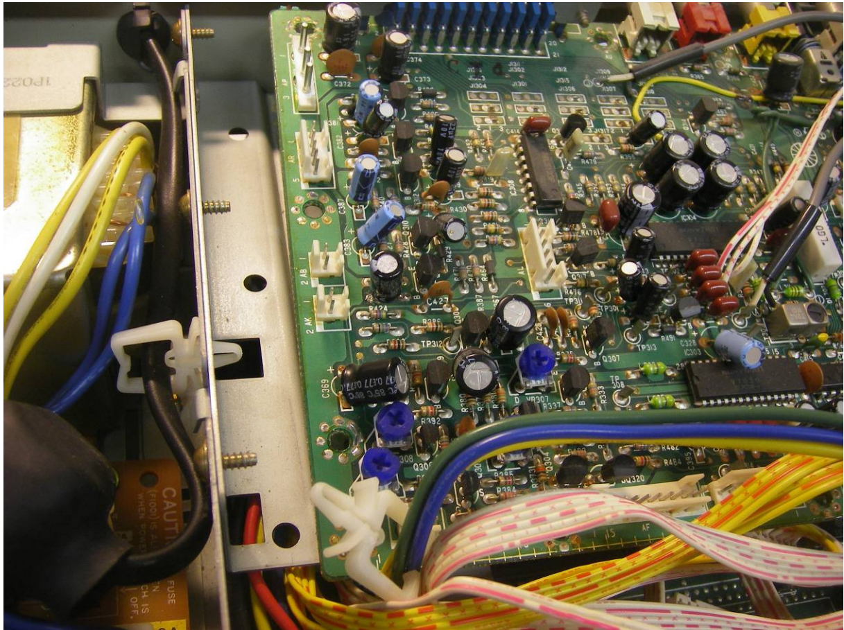
Videoprint van een Philips NMS 8280

Vervang R426 door een condensator van 100 \mu F/16V, met de – richting connector AB.