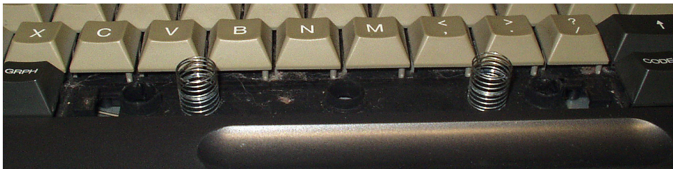
Twee veren geplaatst

Het probleem is nu opgelost en de spatiebalk staat weer recht.