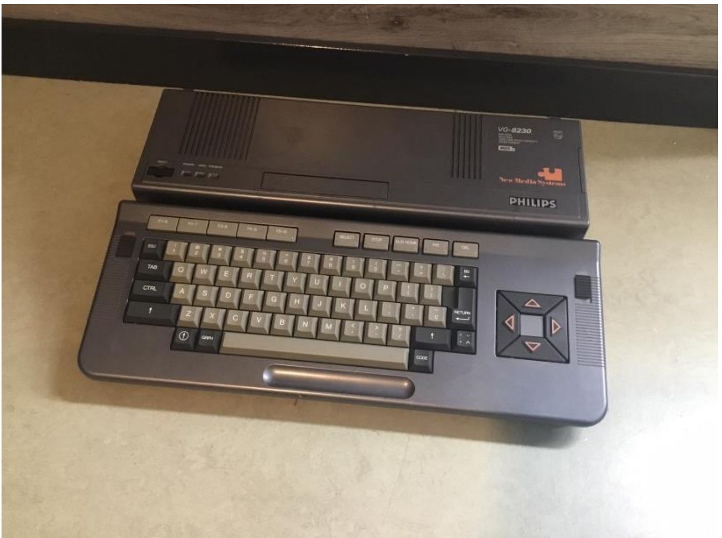
De Philips VG 8230 MSX-2 computer.